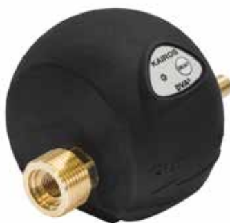
Kairos L Attacco 3/4" G

Kairos L ha una portata massima di 500 l/h adatta per lavastoviglie. È dotato di raccordo da 3/4" G.