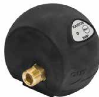
Kairos C Attacco 3/8" G