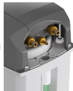
Attacco 3/8" G