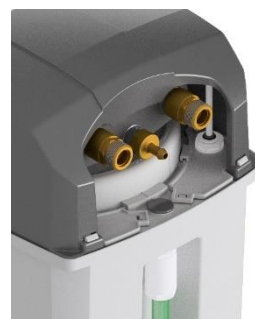
Attacco 3/4" G